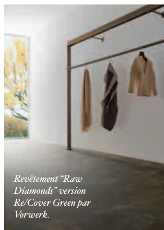
Revêtement "Raw Diamonds" version Re/Cover Green par Vorwerk.

100.000 m 2 de surface sur un seul niveau et plus d'un kilomètre de façade : l'architecte Philippe Cbiambaretta a relevé le pari d'inscrire un morceau de ville dans l'environnement aride de la périphérie. Les lettres du site gravées sur deux plans (un double verre pour donner une profondeur qui joue avec l'incidence de la lumière) se répètent par tronçon de façade ; l'ensemble de l'enveloppe reconstitue le mot en entier. La féerie des reflets selon l'orientation variable de parois vitrées par rapport au dessin du plan de masse dynamise ce grand ensemble à multiples entrées, prolongées par des rues intérieures. Ce signe fort dans le paysage austère de l'aéroport ne le renie pas pour autant, plus, les "plugs" amenant aux avions sont réinterprétés ici comme des belvédères renouant avec l'ancienne tradition de "voir décoller les avions" et brisent l'enceinte translucide mais monolithique.