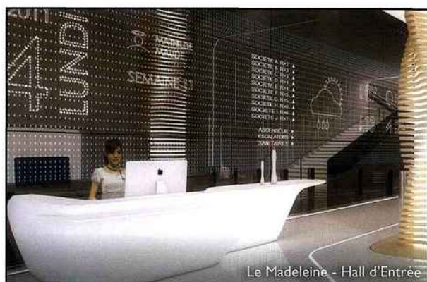
Le Madeleine - Hall d'Entrée