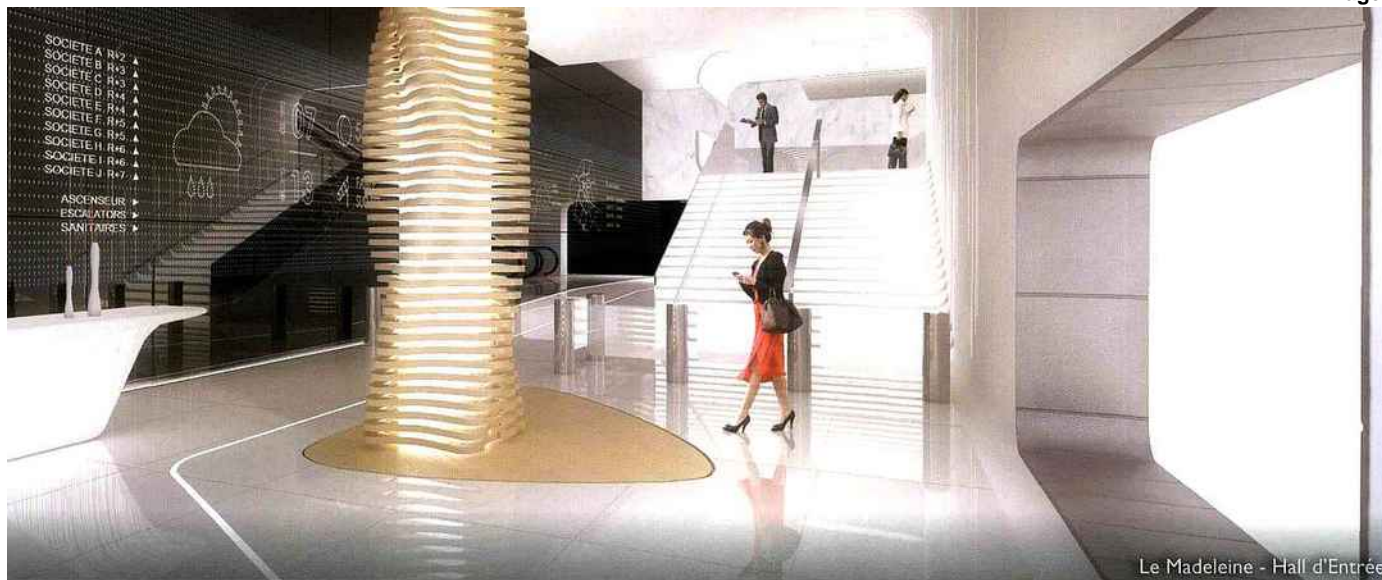
Le Madeleine - Hall d'Entrée