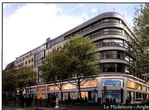
Le Madeleine - Angle

Au centre de cette transformation, le déplacement de l'entrée bureaux et la suppression de la galerie commerciale permettront à la fois de gagner en linéaire de vitrine et de retrouver des magasins équilibrés avec des surfaces d'appel au rez-de-chaussée suffisantes pour alimenter le premier étage. Avec 40m de linéaire au rez-de-chaussée, « Le Madeleine » profitera pleinement du flux exceptionnel de piétons passant devant l'immeuble.